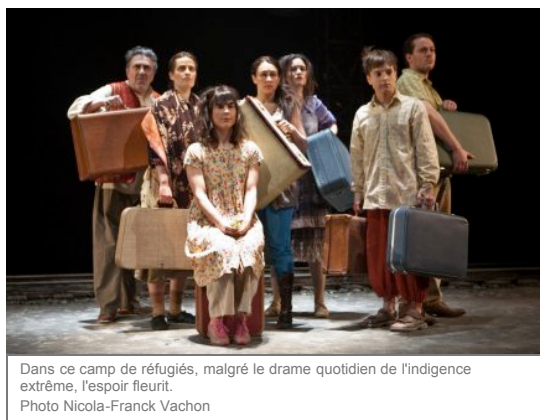
Dans ce camp de réfugiés, malgré le drame quotidien de l'indigence extrême, l'espoir fleurit.